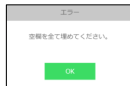
空欄時の警告画面

空欄を埋めた後に画面中央にある「レポートを画像で保存」ボタンを押してください。ボタンを押すと同時に画像データを保存します。画像データの保存先はプログラムの時と同様のフォルダに保存されます。