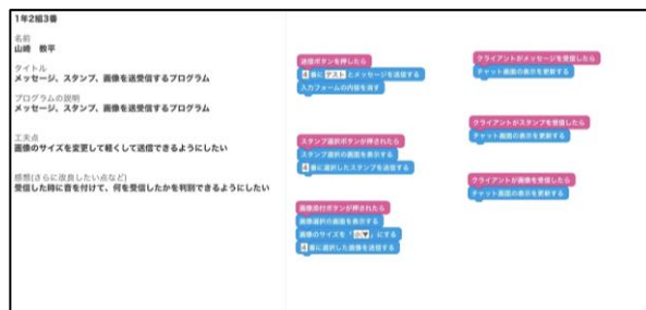
レポート画像データ